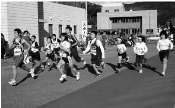
新春の風をきってスタート!

大会は、第58回徳島駅伝の選手3名を擁する西の地Aチームが連覇で15回目の地区優勝を飾りました。