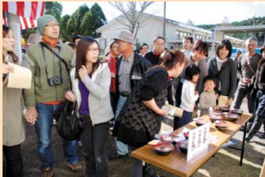
どんぶりの品定めをする来場者の方々