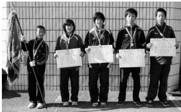
連覇を飾った西の地Aチーム