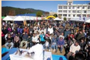
大勢の方々がつめかけたマグロの解体

ひわさ商工祭も同時開催され、郷土料理や地場産品販売のほか、太鼓演奏や吹筒花火など各種イベントも行われました。